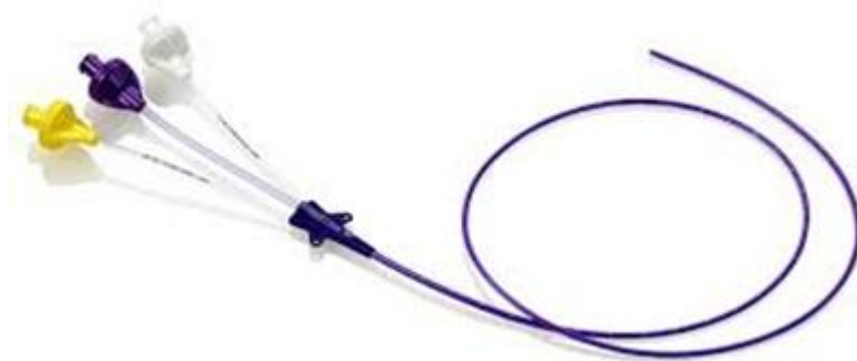
Fig. 1 : Voorbeeld van een PICC met drie lumina.

PICC staat voor 'peripherally inserted central catheter' ofwel 'perifeer ingebrachte centraal veneuze katheter'. Het is een dun slangetje (katheter) van ongeveer 50 cm lang dat via een bloedvat in de bovenarm wordt ingebracht en opgeschoven tot net boven het hart. De katheter bestaat na het inbrengen uit een uitwendig en een inwendig deel. Aan het uitwendige deel zitten één of meerdere uiteinden, ook wel lumina genoemd. Het aantal lumina dat de katheter telt, hangt af van de behandeling. Elk lumen kan afgesloten worden met een dopje of aangesloten worden aan een infuus. Op het uiteinde van elk lumen zit een klemmetje bevestigd. Hiermee kan het lumen open en dicht gezet worden.